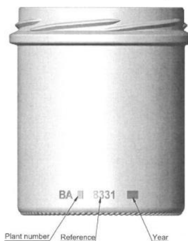
Plant number Reference Year